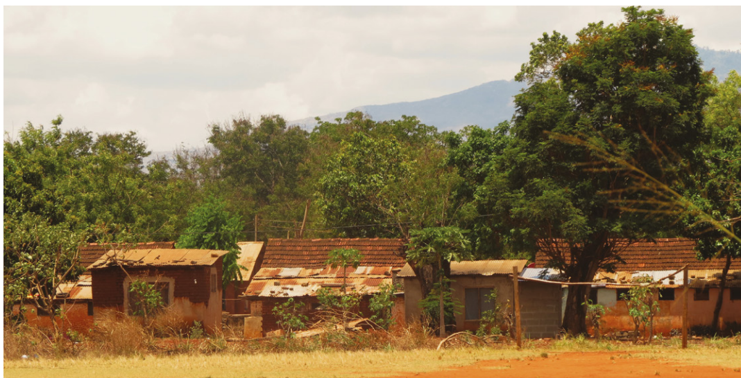
Links: Die beiden Bilder vom Stadtrand von Morogoro vermitteln einen Eindruck davon, wie die meisten Familien mit ihren 4 bis 5 Kindern und oft weiteren Angehörigen leben. Die meisten Hütten aus Ziegelstein oder Holz und Lehm haben einen einzigen Innenraum, gekocht wird unter einem Vordach, Trinkwasser gibt es aus einer Zisterne.