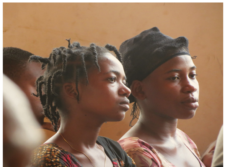
Diese und folgende Seite: Am Parents Day lauschten die Eltern und Geschwister den musikalischen Beiträgen der Schülerinnen

Auf die gleiche Art werden die 4. Klässler über HIV und AIDS, das menschliche Immunsystem, die Biologie von Viren oder über die Fortpflanzung bei höheren Blütenpflanzen aufgeklärt und geprüft. Auch hier lasse ich zur Illustration ein paar Fragen folgen aus der letzten Prüfung für die 4. Klasse im Mai 2024 (Fach Science and Technology ):