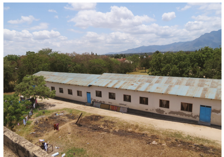
Links: Blick auf das Gelände der ELU Childen Care am Stadtrand von Morogoro. Zur Schule gehören rund 12 Gebäude. Aus klimatischen Gründen sind alle Fenster offen und nur mit Gittern versperrt. Rechts: Das Girls Dormitory ist ein langer Trakt mit zwei Innenräumen. Hier wohnen die Mädchen der Secondary School (siehe auch Bild auf der Folgeseite).