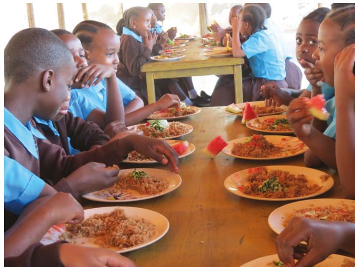
Die Kinder bekommen in der Schule jeden Tag ein nahrhaftes Frühstück und ein warmes Mittagessen. Meist gibt es Reis, Bohnen und gedämpftes Blattgemüse sowie ein Stück Melone. Das Essen sieht nicht nur schön aus, sondern ist auch äußerst lecker.