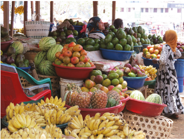
Die Straßenmärkte und Läden in Morogoro und Daressalam sind prall voll und bereits fürs Auge ein Leckerbissen. Das meiste sind tansanische Produkte, die aus kleinbäuerlichem Anbau der Region stammen

alle materielle Hilfen hinaus die menschlichen Begegnungen, wozu nicht nur freundschaftliche Besuche, sondern z.B. auch gemeinsame künstlerische Projekte eine gegenseitige Bereicherung und Stärkung bedeuten.